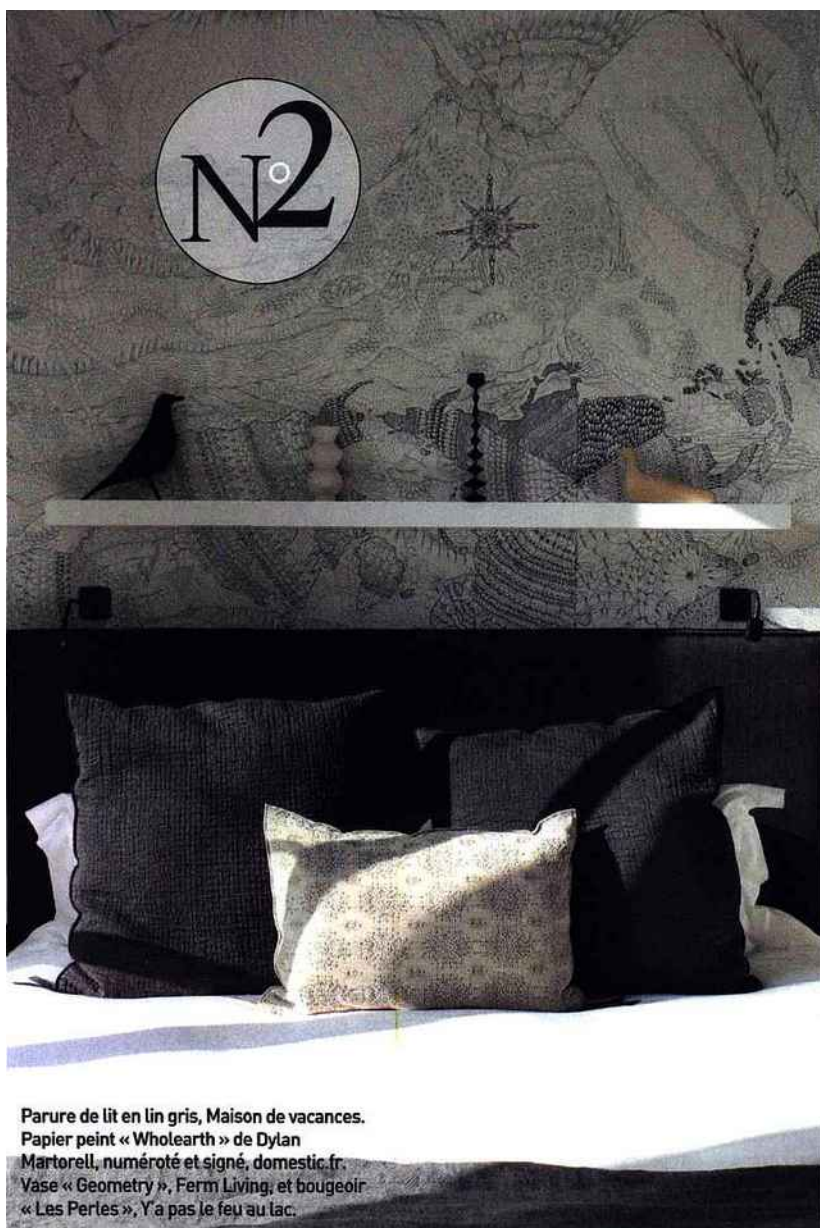
Parure de lit en lin gris, Maison de vacances. Papier peint « Wholearth » de Dylan Martorell, numéroté et signé, domestic.fr. Vase « Geometry », Ferm Living, et bougeoir « Les Perles », Y'a pas le feu au lac.